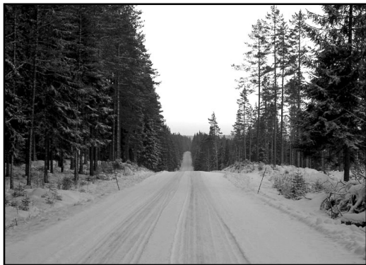
Treöresvägen mellan Gammelbo och Kloten.