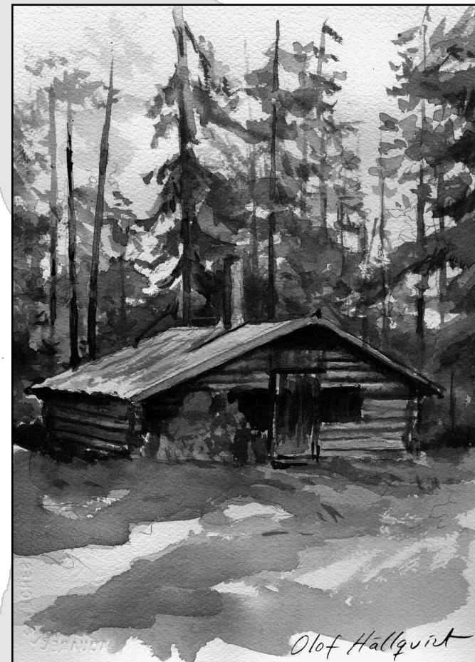
Rif-kojan utmed Treöresvägen till Kloten.